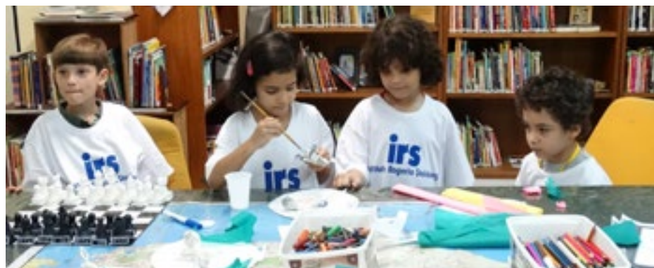
Participantes do IRS em atividade da Oficina de Criação, realizada com apoio do Projeto Complementar, CMDCA e Prefeitura do RJ/SMAS

das Oficinas Norteadoras (Oficina de Criação/Informática Educativa, Empreendedorismo e Orientação Profissional) e das Oficinas do Talento Específico (Artesanato, Jornal, Música e Teatro). A meta de atendimento é de cerca de 160 crianças e adolescentes participantes do Programa Desenvolvendo Talentos.