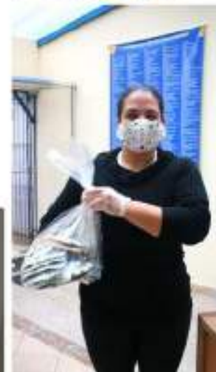
Post sobre ação de doação de alimentos