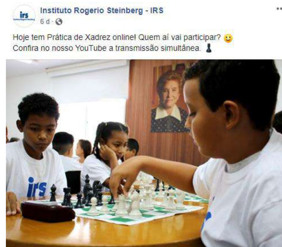
Post sobre Prática de Xadrez online