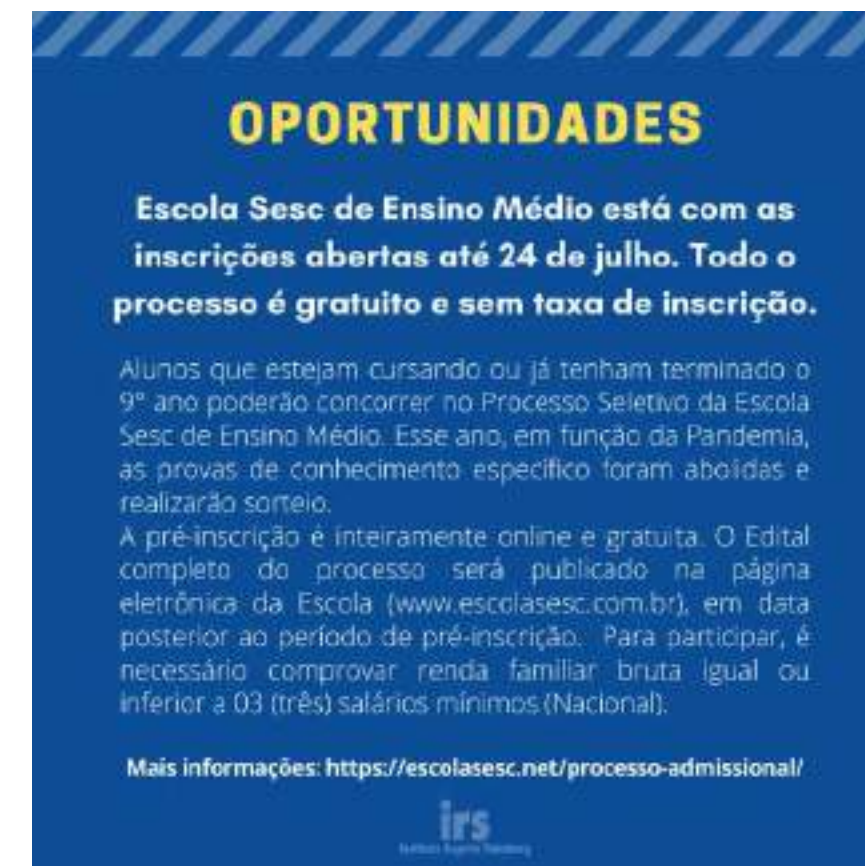
Divulgação de oportunidade