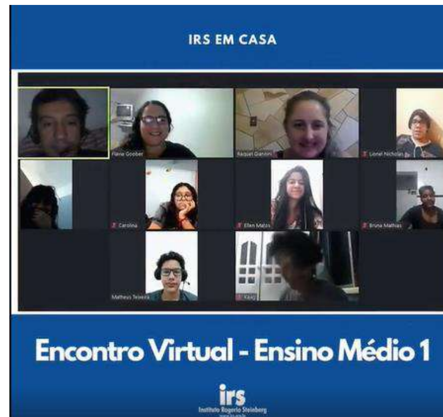
Post sobre Encontro Virtual