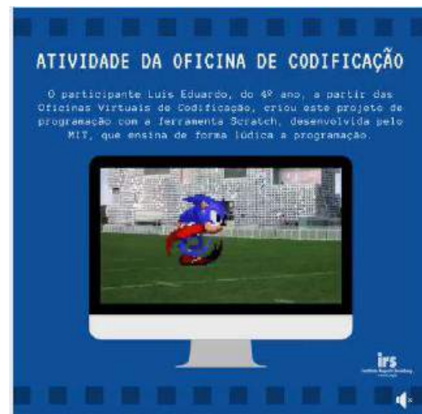
Pequeno vídeo para as redes sociais sobre a atividade realizada por participante na Oficina de Codificação