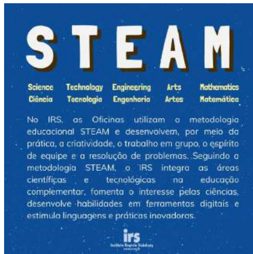
Post sobre conceitos STEAM