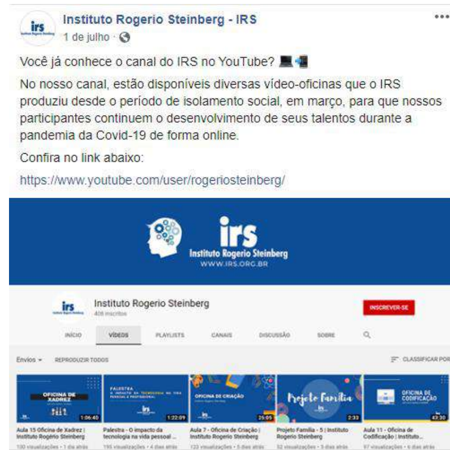
Post de divulgação do canal do IRS no YouTube