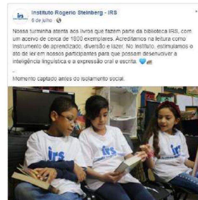
Post sobre leitura