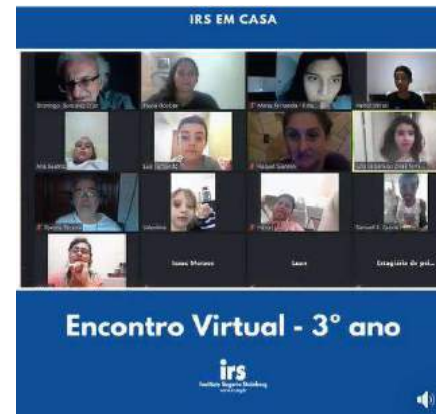
Post sobre Encontro Virtual