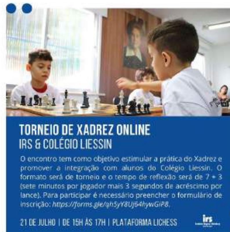
Post de divulgação do torneio de xadrez IRS & Colégio Liessin