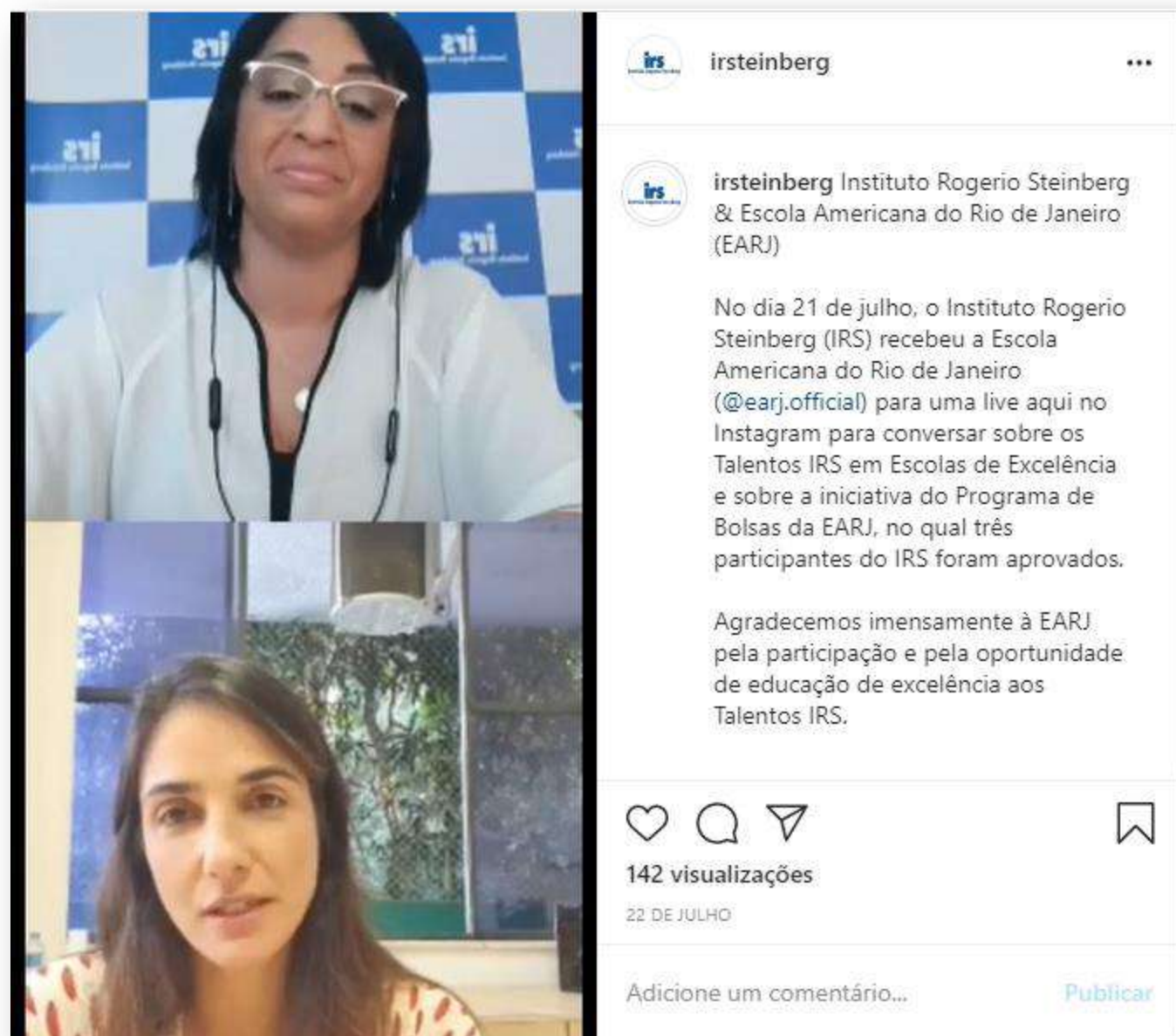
Live realizada no Instagram do IRS em parceria com a Escola Americana do Rio de Janeiro - EARJ