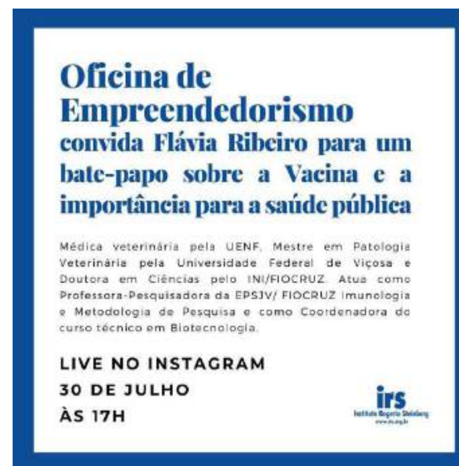
Divulgação live Empreendedorismo