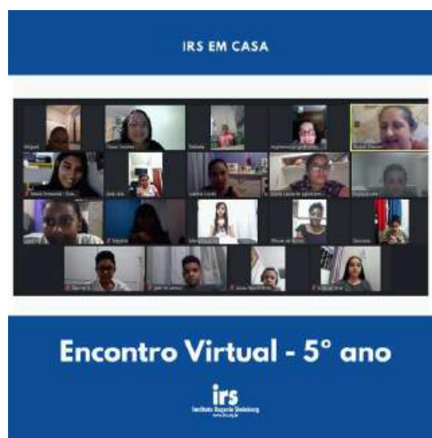
Post sobre encontro Zoom