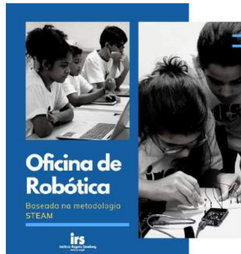
Post sobre a Oficina de Robótica do IRS