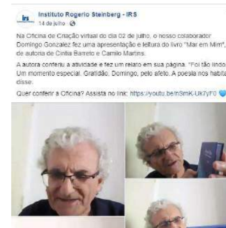
Post sobre depoimento da autora de um livro trabalho pelo Domingo na Oficina de Criação