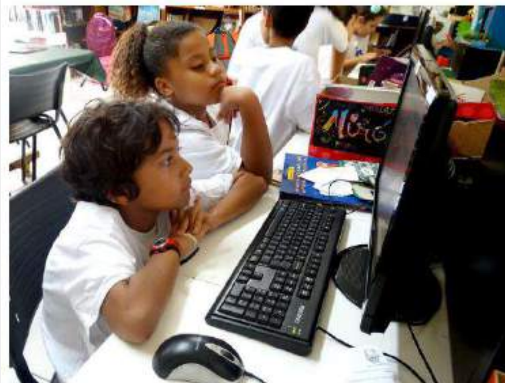
Secretaria de Educação formou parceria voltada a alunos com superdotação e altas habilidades.

Publicado em 27/07/2020 - 14:35 | Atualizado Início / Educação / Prefeitura desenvolve talentos de