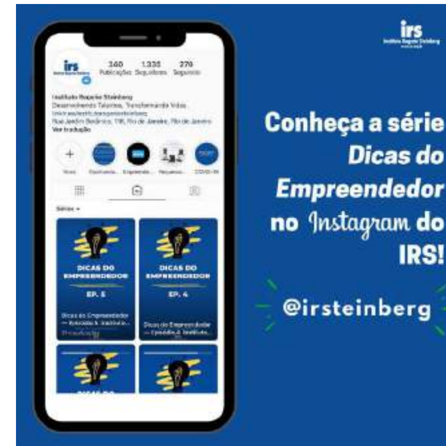
Post de divulgação da atividade da Oficina de Empreendedorismo