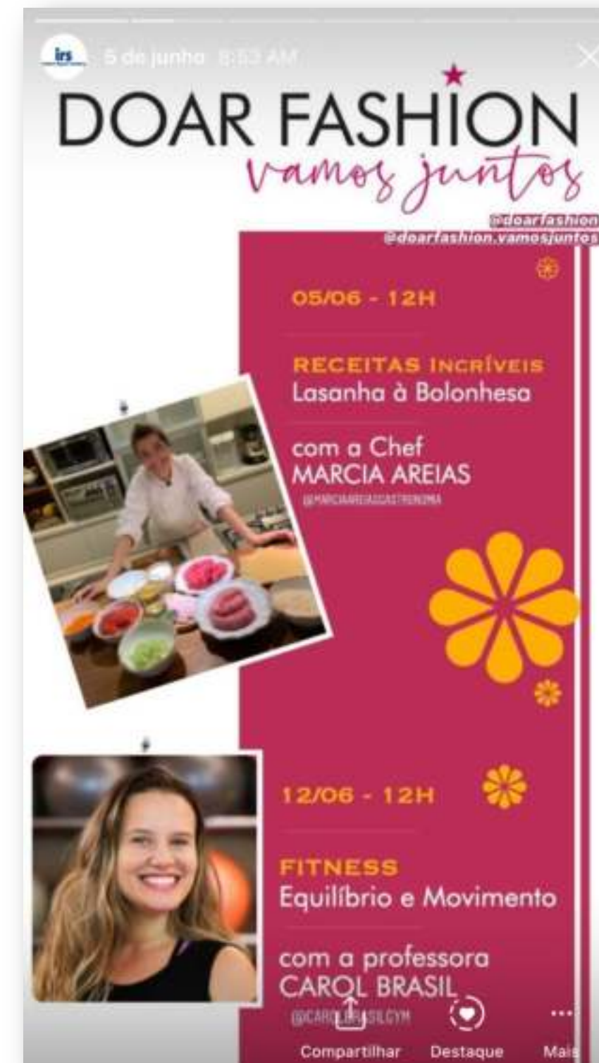
Divulgação Doar Fashion, Vamos Juntos