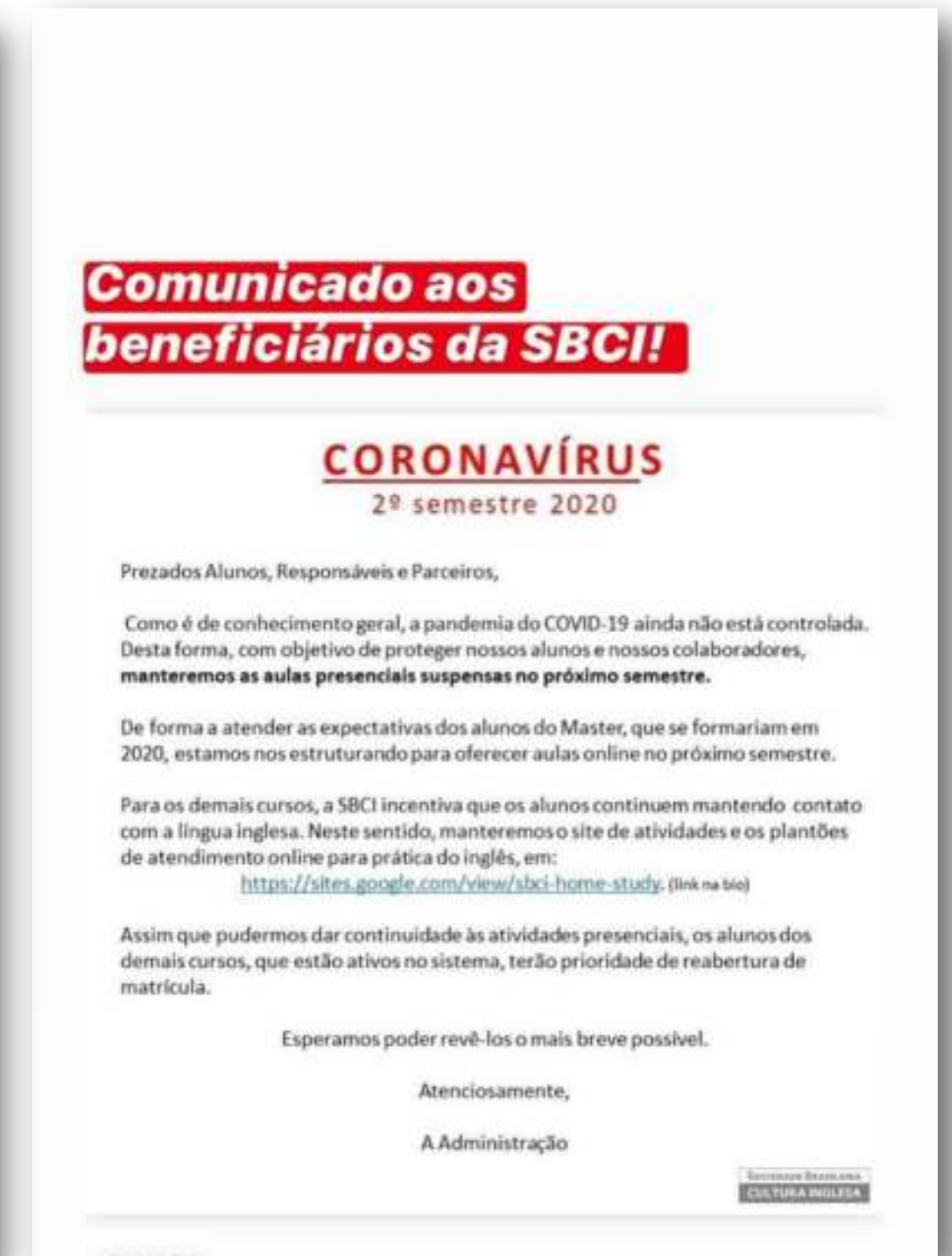
Divulgação de Comunicado da Parceira Sociedade Brasileira de Cultura Inglesa