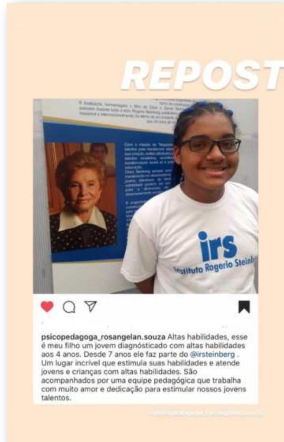
Divulgação de postagem feita por responsável de participante