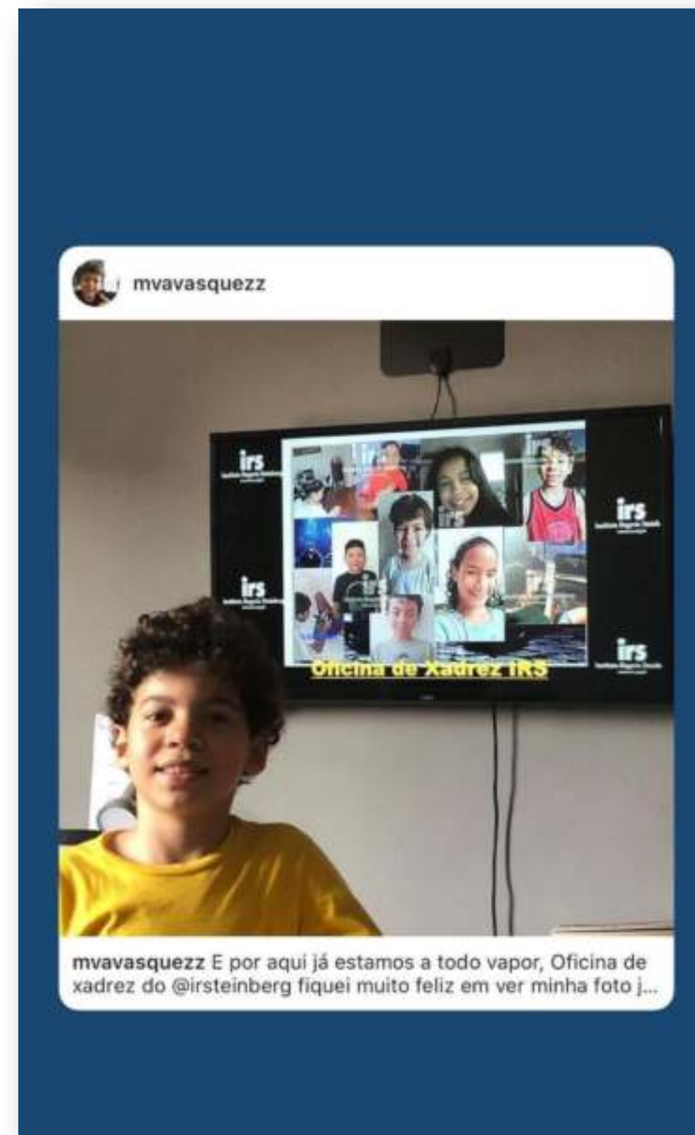
Divulgação de Post participante IRS