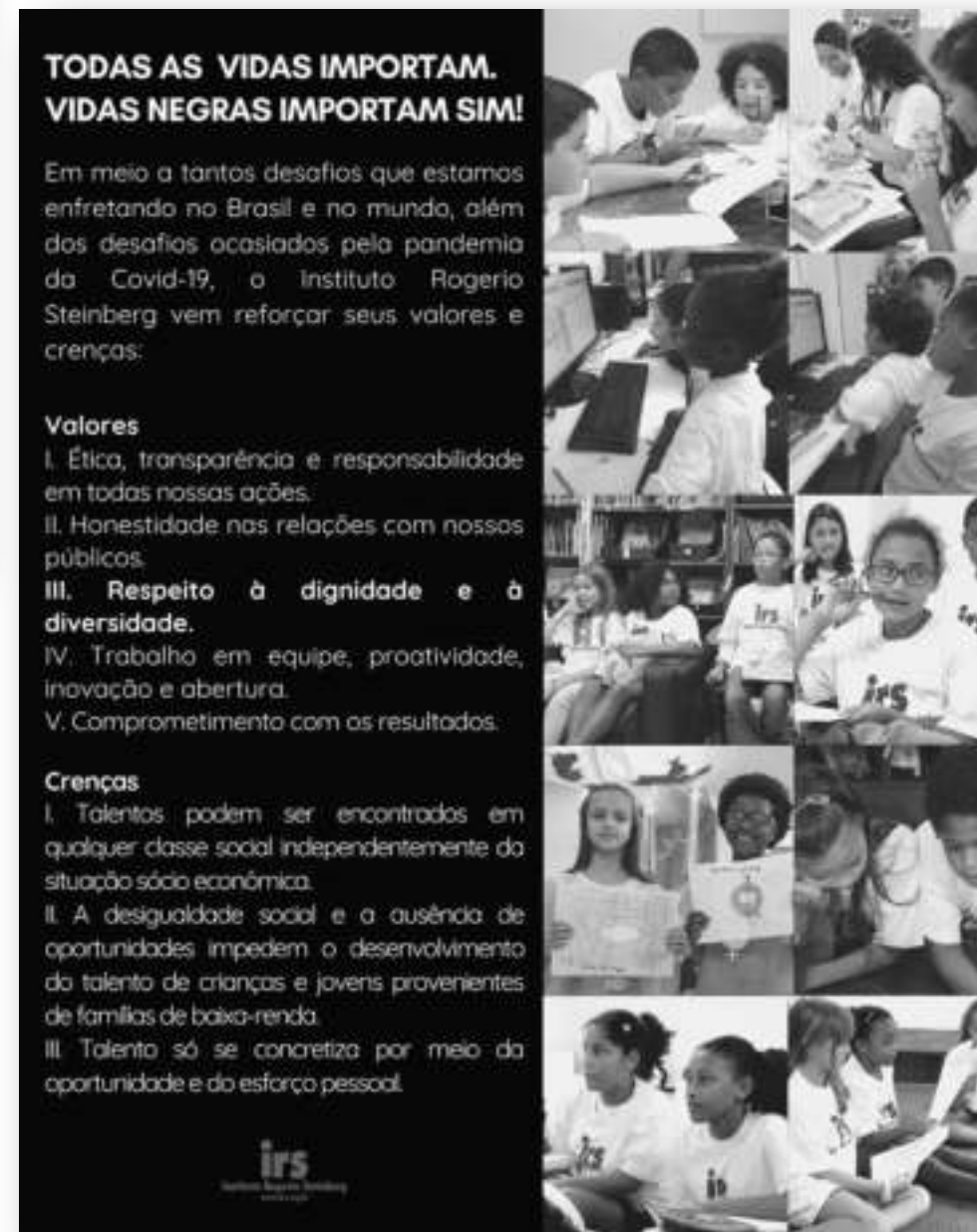
Post Todas as Vidas Importam #blacklivesmatter #vidasnegrasimportam