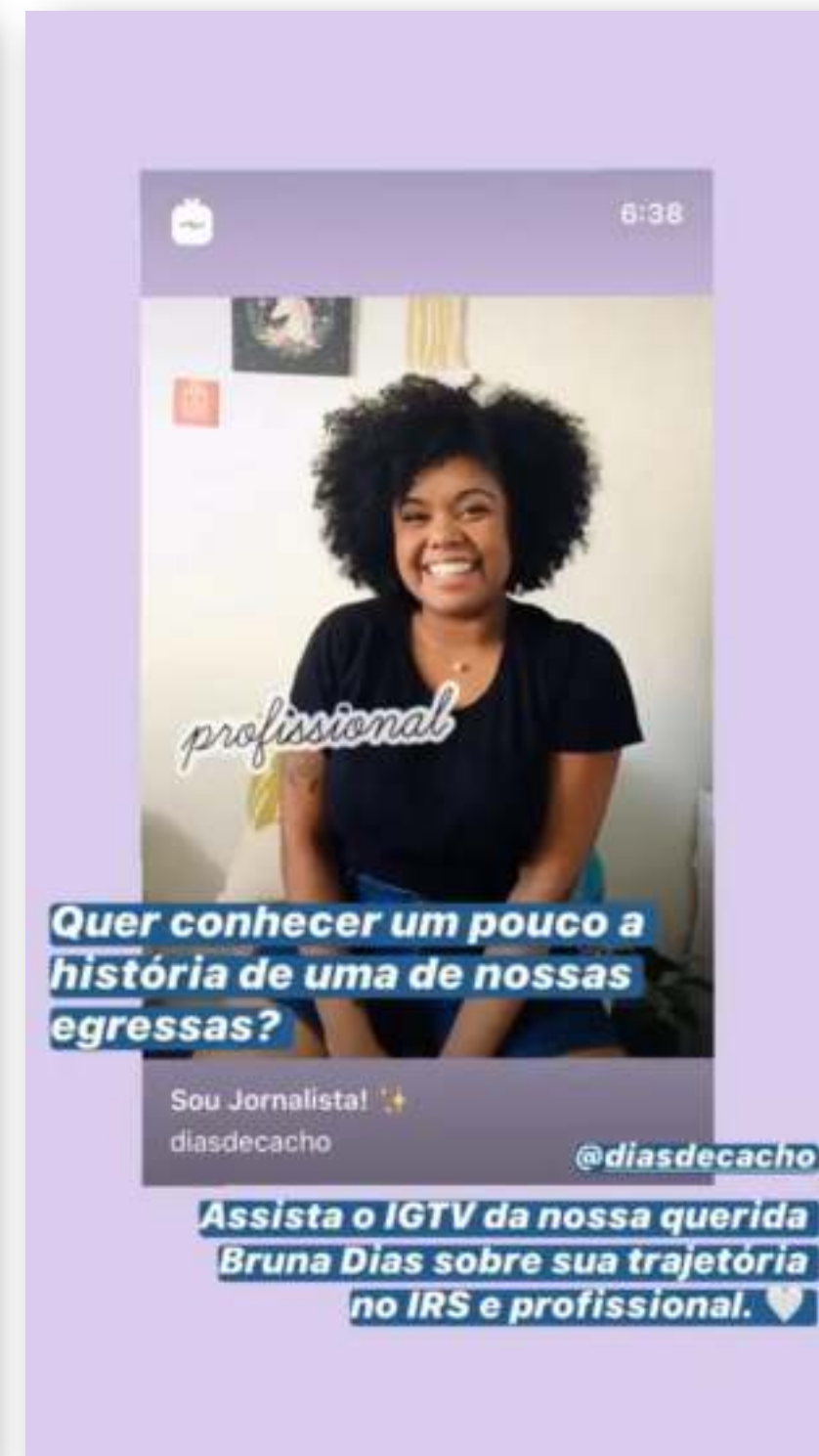
Divulgação Vídeo Egressa IRS