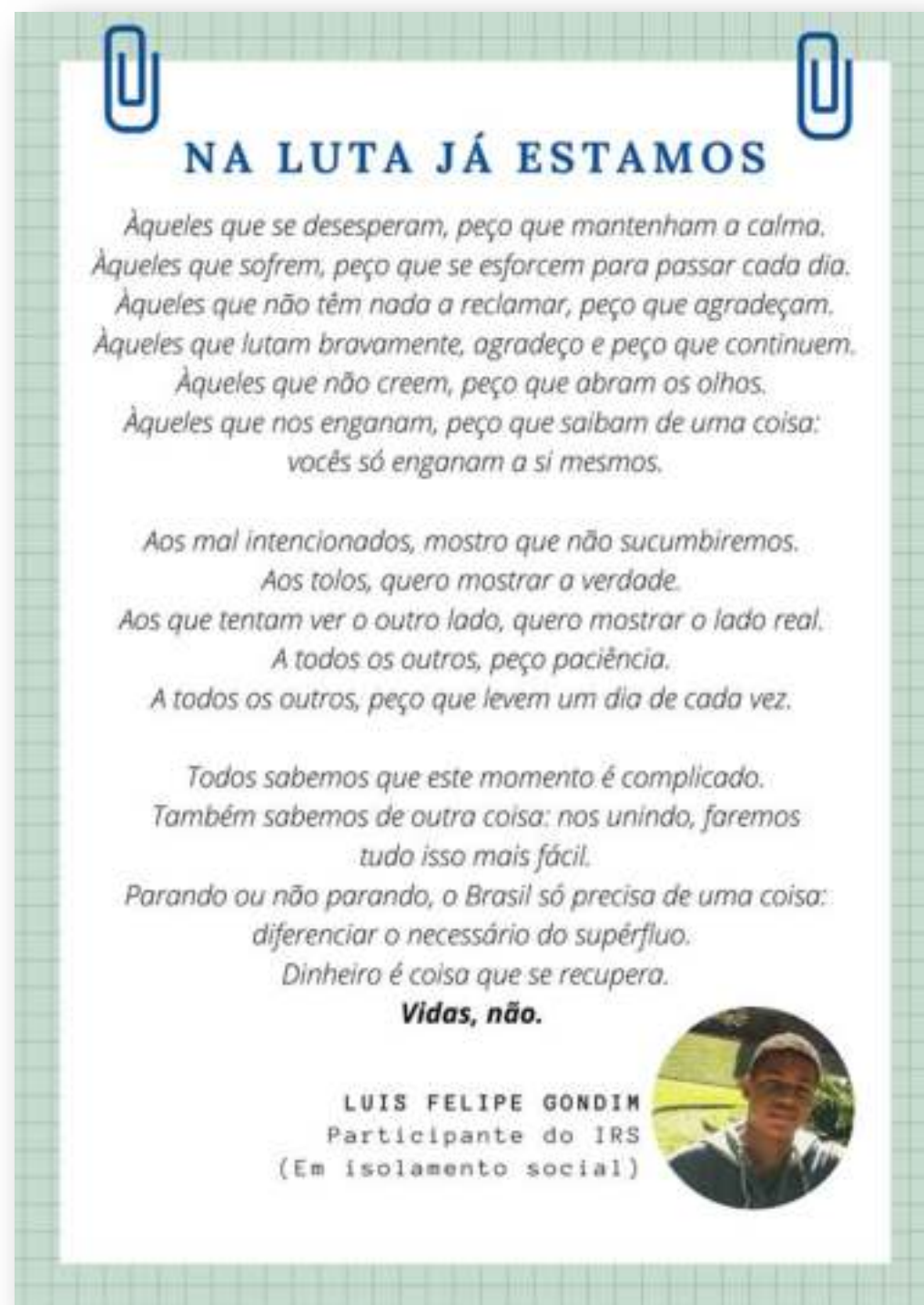
Post com o texto do participante Luis Felipe