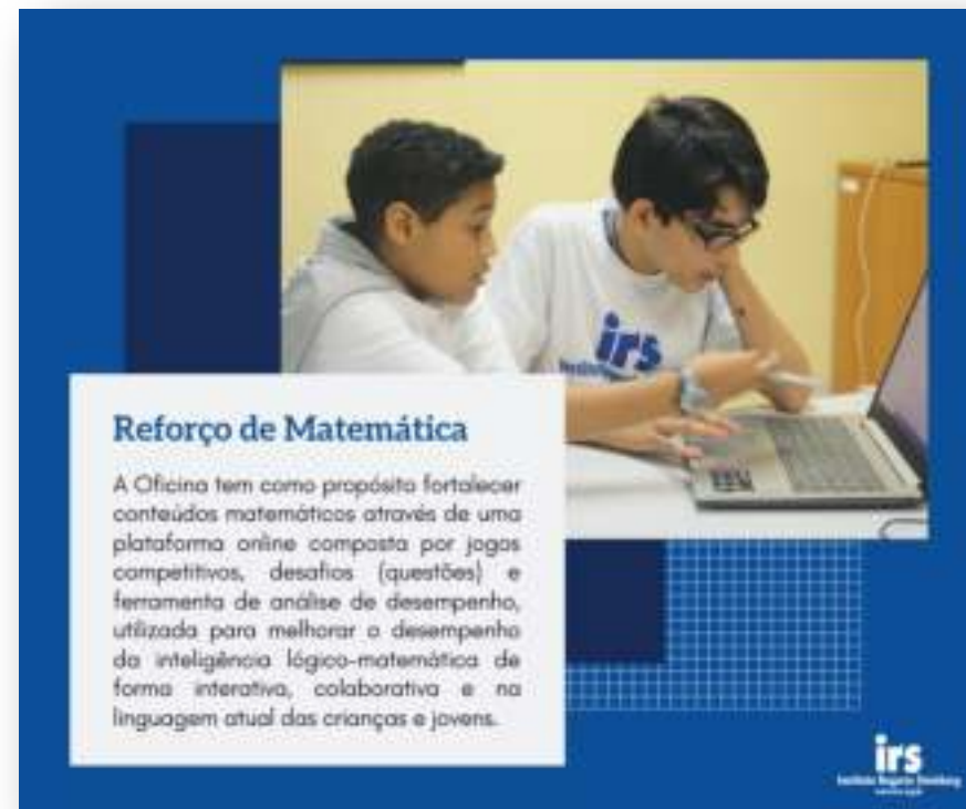
Divulgação Oficina IRS