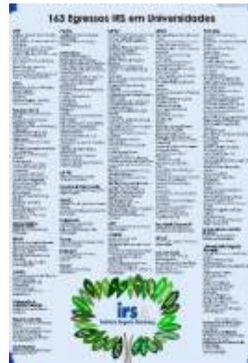
Resultado egressos 2º semestre