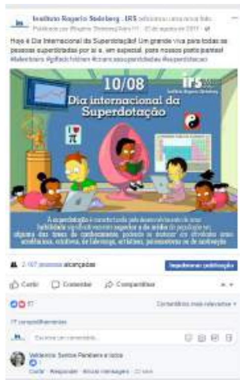
Publicação na fanpage do IRS (10/08/17)

A publicação teve 17 compartilhamentos, número acima da média para posts.