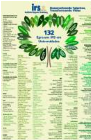
Resultado egressos 1º semestre