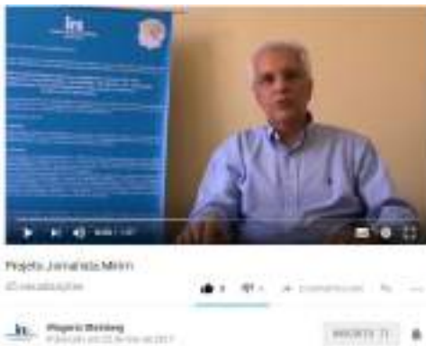
Vídeo institucional de apresentação do Projeto ta Mirim. https://www.youtube.com/watch?v=diiwaGwY_tc