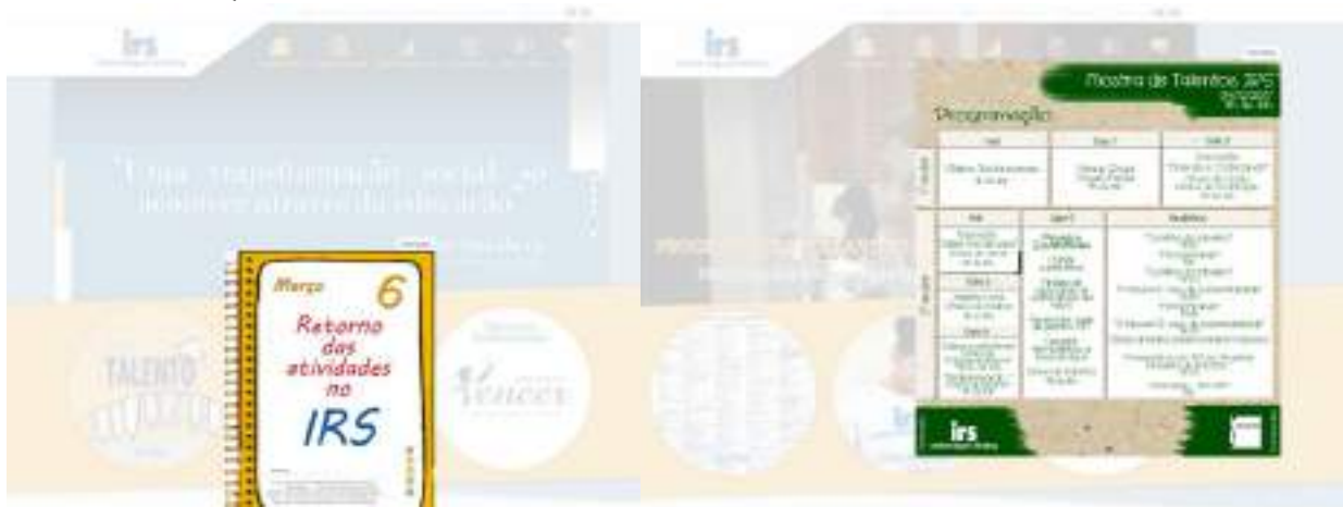
Divulgação do retorno das atividades