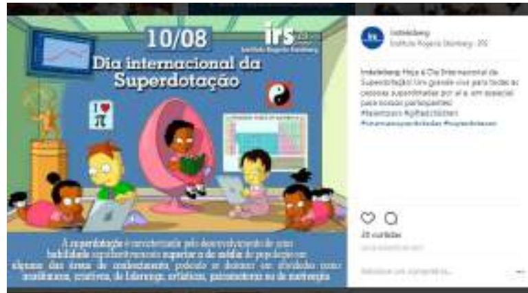
Publicação no Instagram do IRS (10/08/17)

-Dia Internacional da Superdotação (10/08): Celebramos em nossas mídias o Dia Internacional da Superdotação, como estratégia para divulgar a causa das AH/SD.