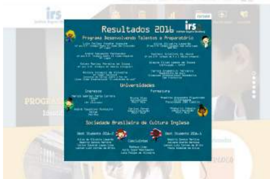
Divulgação de resultados de participantes e egressos em 2016