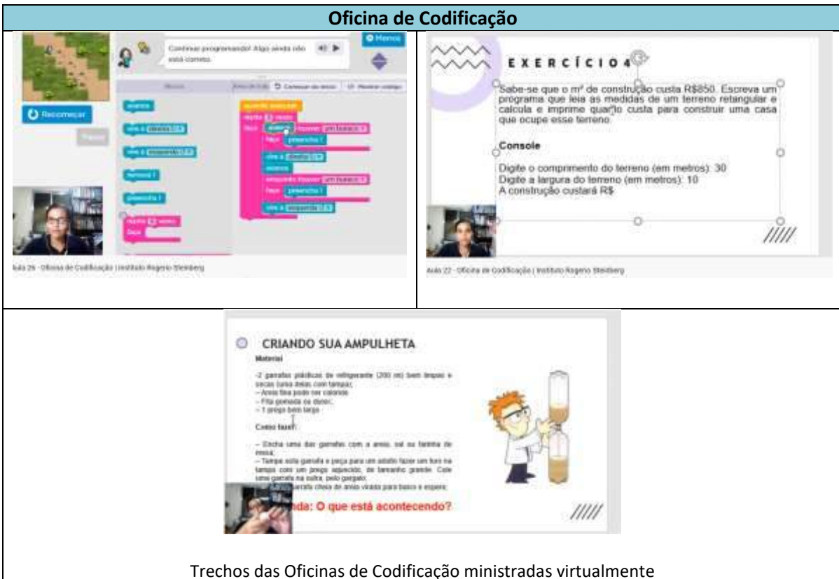
Trechos das Oficinas de Codificação ministradas virtualmente

Origem dos recursos financeiros: Recursos de doações e parcerias com empresas, entidades privadas, convênio com órgãos e apoio de pessoa física.